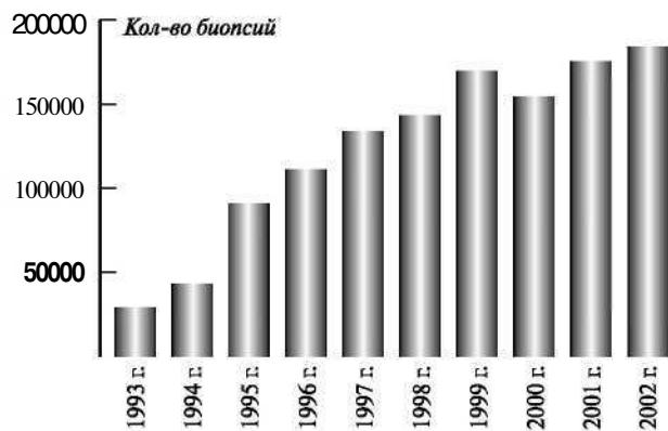
Рис. 1. Динамика исследований биопсийного и операционного материала во Владивостокском городском патолого-анатомическом бюро [5].