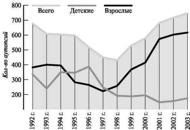
Рис. 3. Динамика аутопсийных исследований на базе Приморского института региональной патологии в 1992–2003 гг.

неполные аборт и трубная беременность. В единичных случаях зарегистрированы ятрогении: синдром массивных трансфузий и анафилактические реакции на медикаменты.